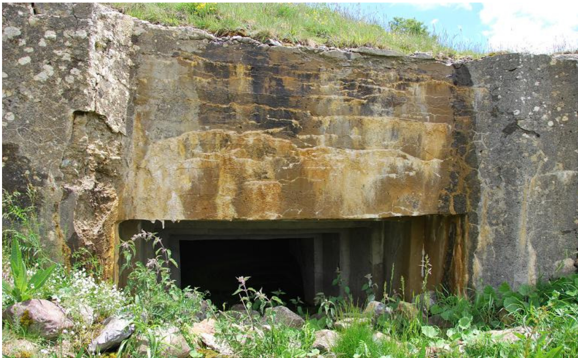
Obra 63 para Cañón anticarro

La mayoría se conservan en buenas condiciones, otras o han sido destruidas o engullidas por el terreno.