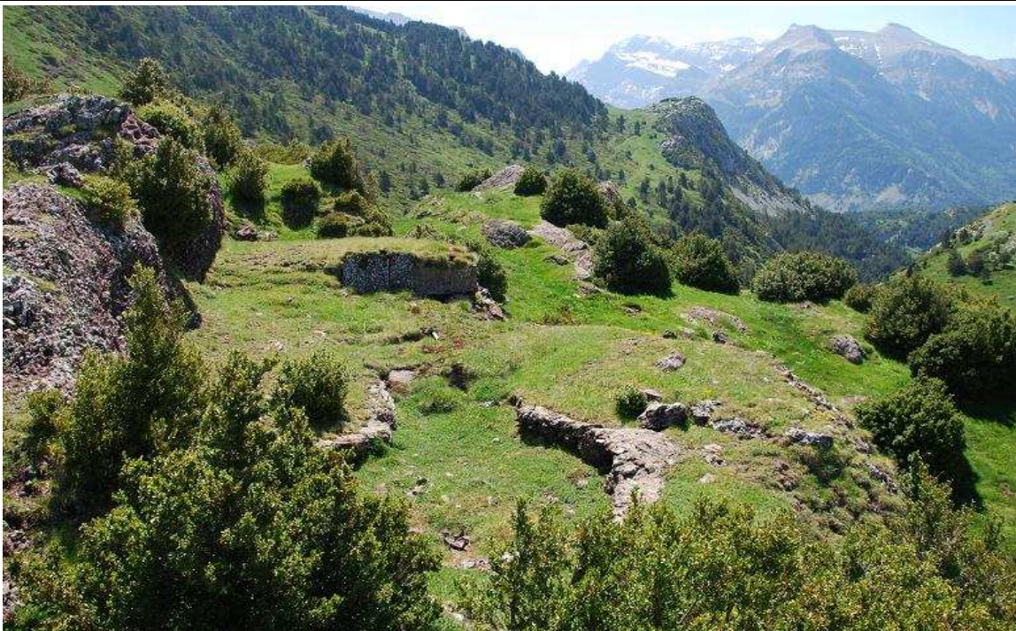
NR 113. OBRA A-1 para Ametralladora antiaérea

La mayoría se conservan en buenas condiciones, otros o han sido destruidos o engullidos por el terreno.