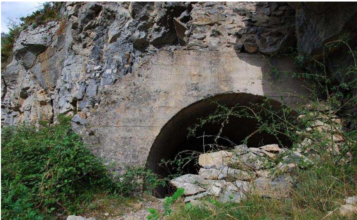
NR.119. OBRA C-1 para Cañón Infantería

La mayoría se conservan en buenas condiciones, otros o han sido destruidos o engullidos por el terreno.