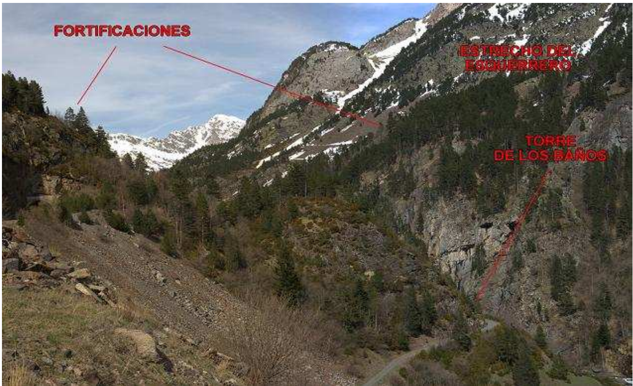
Fotografía e indicaciones según Fundación Hospital de Benasque