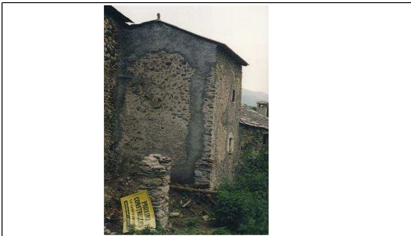
© José M a Establés Elduque, hacia 1980

De uso particular se encuentra en buen estado, aunque algo restaurada.