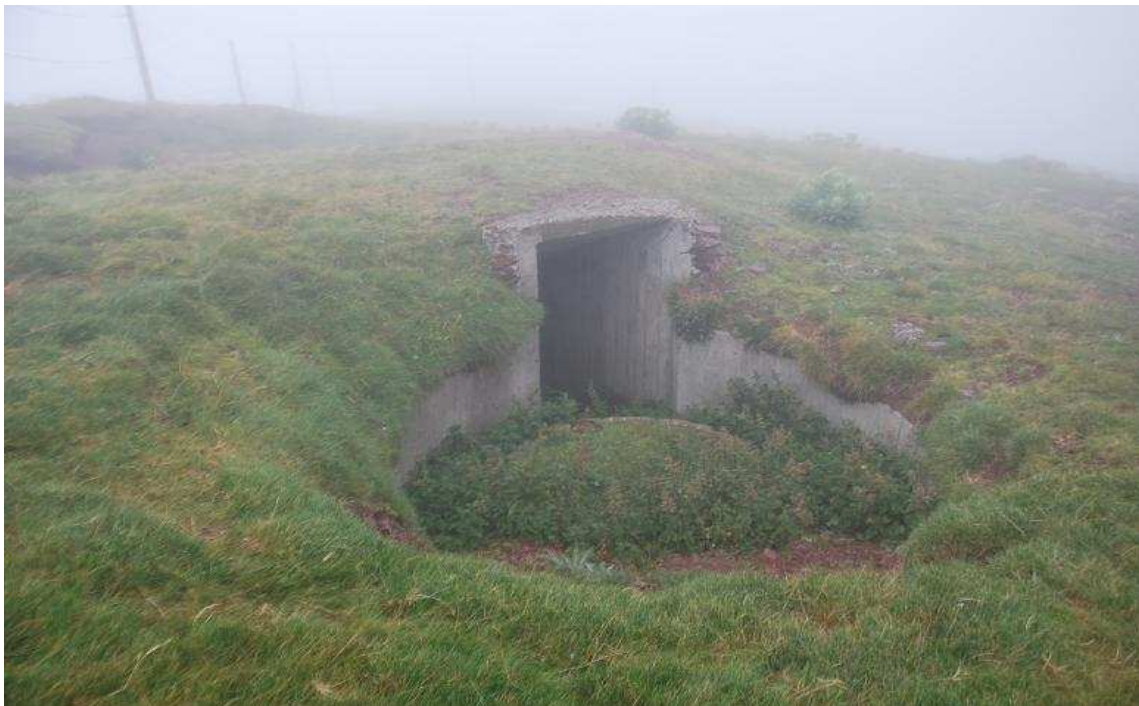
NR 114. OBRA M-7 y M-8, para morteros de 81 mm

La mayoría se conservan en buenas condiciones, otros o han sido destruidos o engullidos por el terreno.