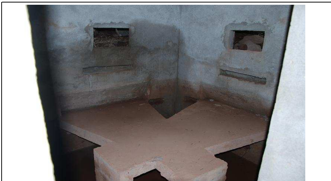
NR 115. OBRA 33-M. Interior de una obra para ametralladora doble

La mayoría se conservan en buenas condiciones, otros o han sido destruidos o engullidos por el terreno.