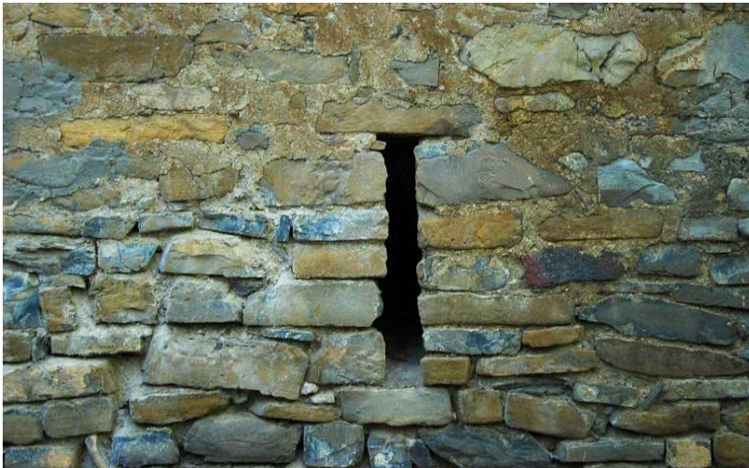
Detalle de la aspillera conservada