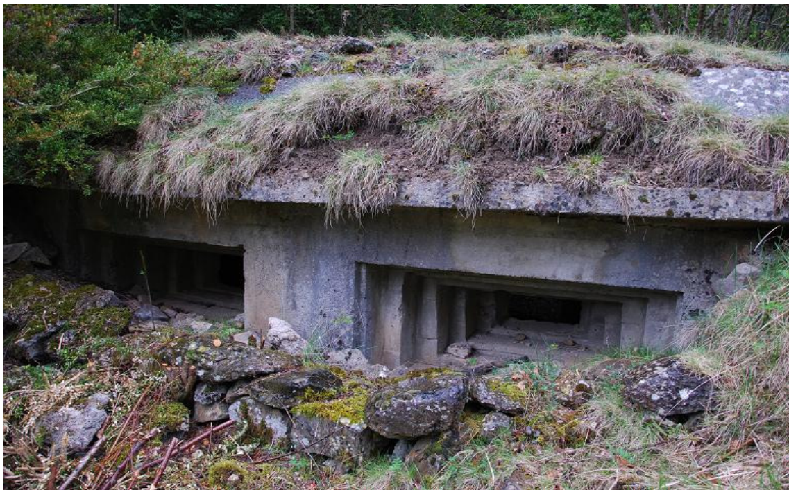
Obra 26-27, doble para Ametralladora

La mayoría se conservan en buenas condiciones, otros o han sido destruidos o engullidos por el terreno. Una parte de este núcleo, concretamente la zona de Santa Elena se ha señalado sus obras y se han colocado paneles informativos.