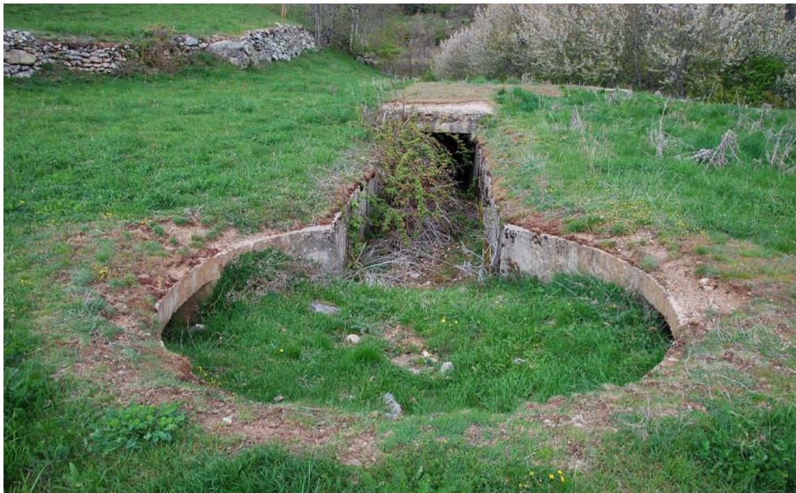
Obra 42 para Ametralladora antiaérea

La mayoría se conservan en buenas condiciones, otras o han sido destruidas o engullidas por el terreno.