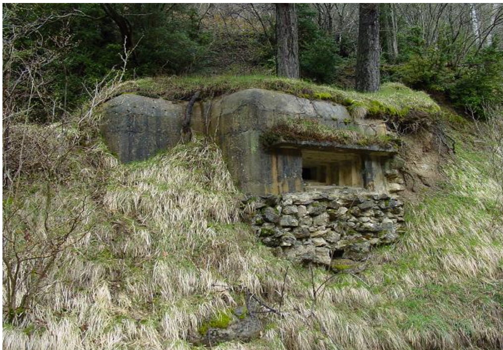
Obra 11 para ametralladora

La mayoría se conservan en buenas condiciones, otros o han sido destruidos o engullidos por el terreno, o incluso sumergidas en el pantano de Lanuza