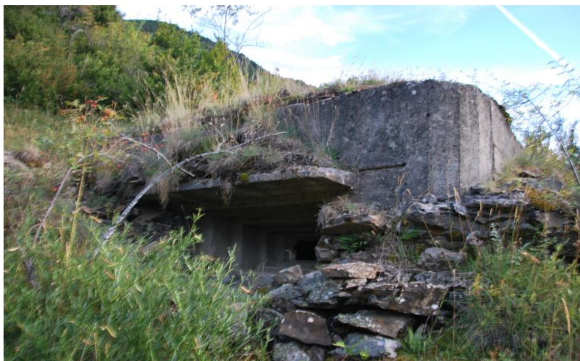
Obra 12 para Fusil ametrallador

La mayoría se conservan en buenas condiciones, otros o han sido destruidos o engullidos por el terreno.