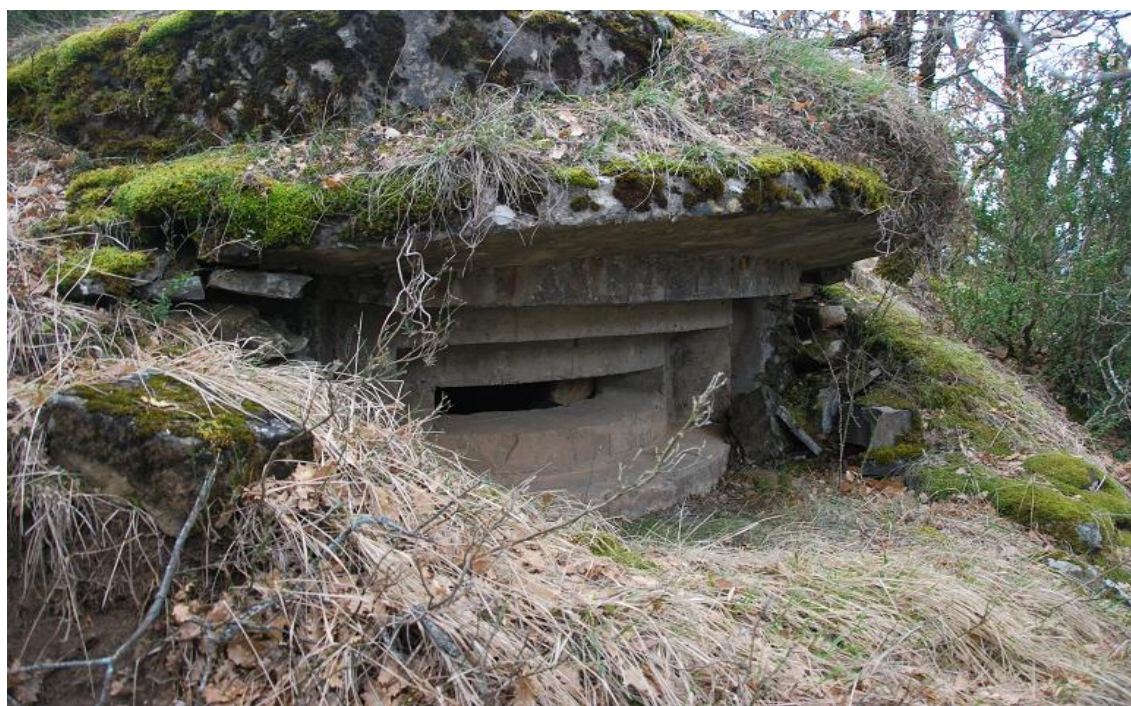
Obra 57 para Observatorio puesto de mando

La mayoría se conservan en buenas condiciones, otros o han sido destruidos o engullidos por el terreno.