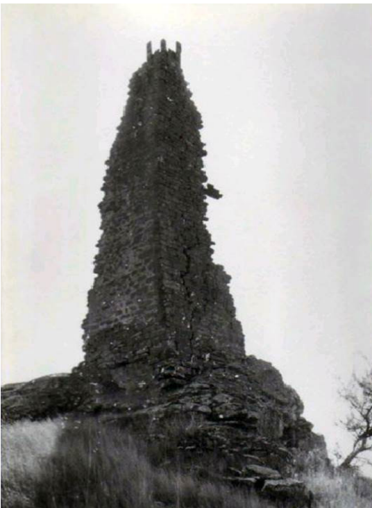
Restos de la Torre Aguilar, quizás hacia los años 60 del s. XX, autor desconocido