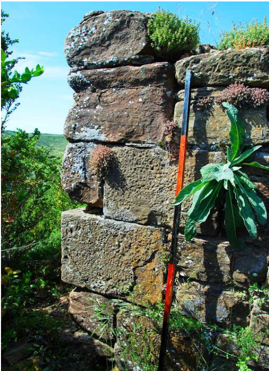
Detalle de los sillares esquinados