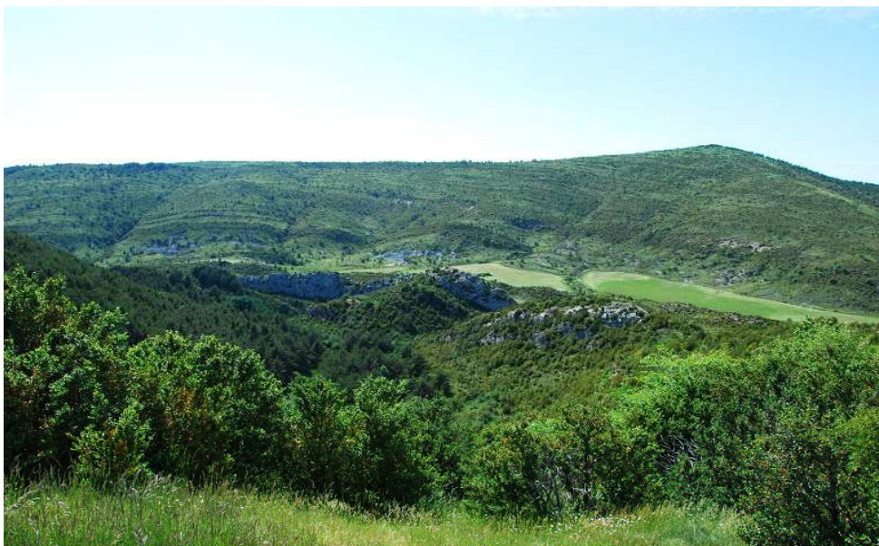
Vista desde la torre del antiguo camino que iba a Luesia