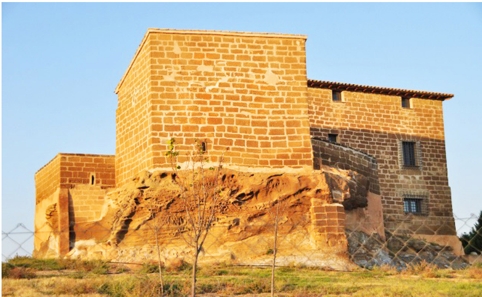
Dos aspectos más del exterior de la fortaleza