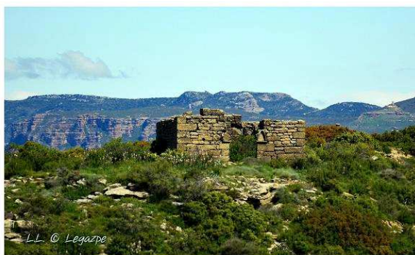
Vista del acceso a ermita, siendo esta una ampliación a la torre.

Lorien Lahoz, mayo 2018, y fotografía inferior Antonio García Omedes