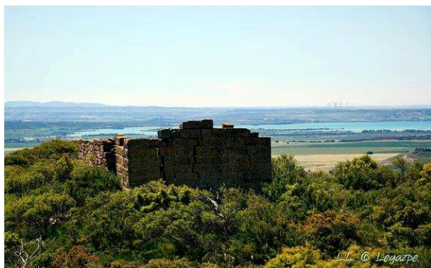
Vista hacia el S de la torre