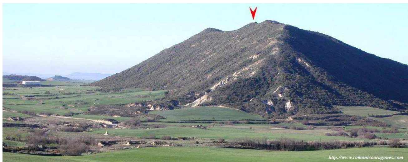
La flecha roja señala la ubicación de la torre y ermita