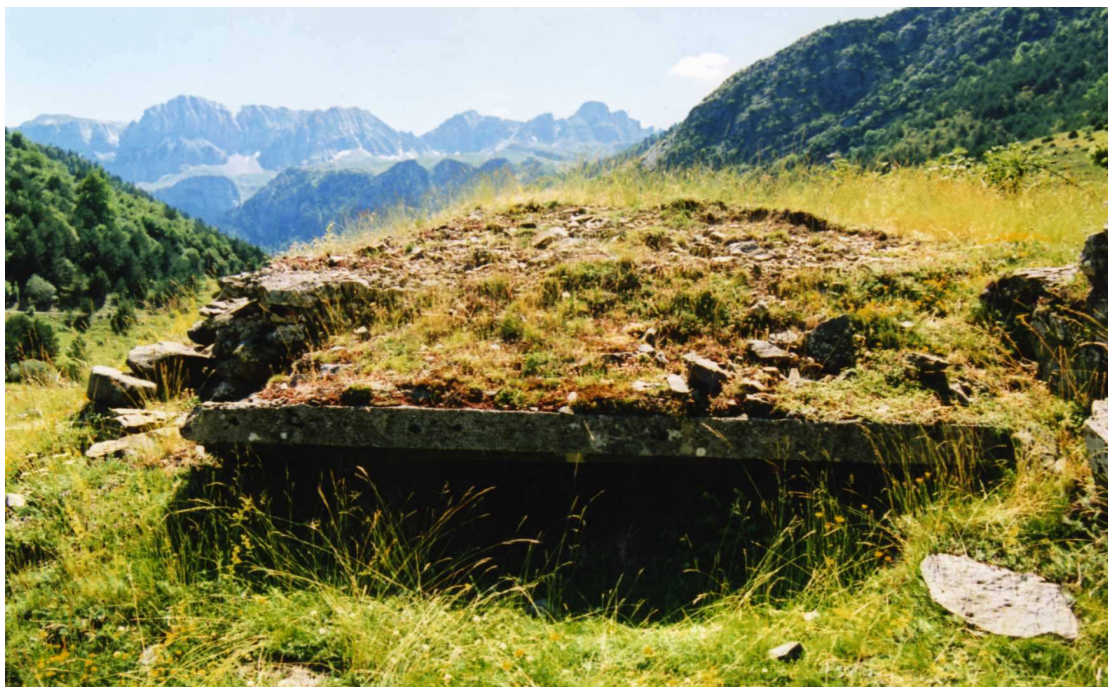
NR 117, OBRA 21-F para ametralladora

Se conservan en buenas condiciones, pese a estar rodeados de zarzas.