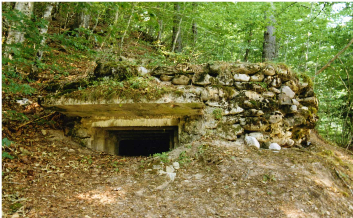
NR 118. Obra 31-D para Ametralladora

La mayoría se conservan en buenas condiciones.