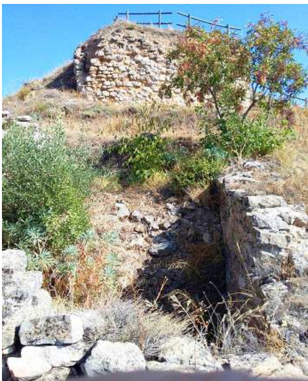
Detalle del aljibe y de la torre