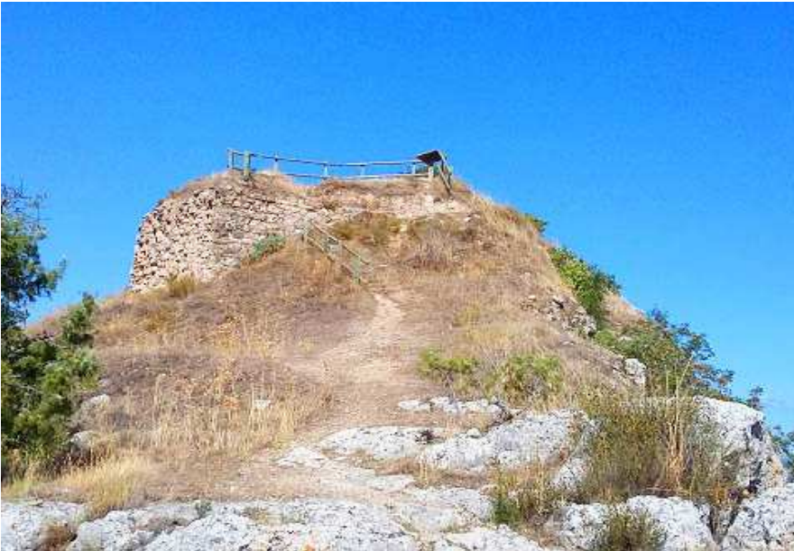
La torre principal