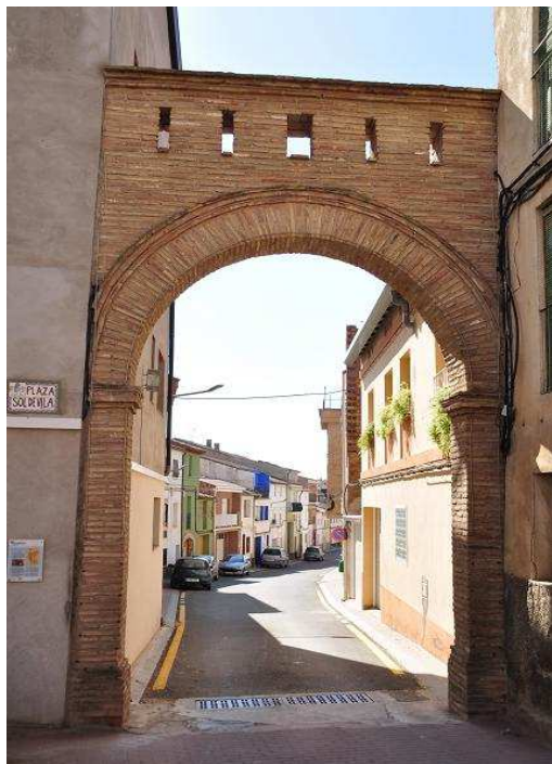
Portal Sol de Vila