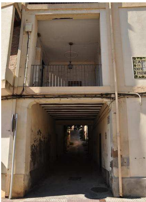
Portal de la Cuesta