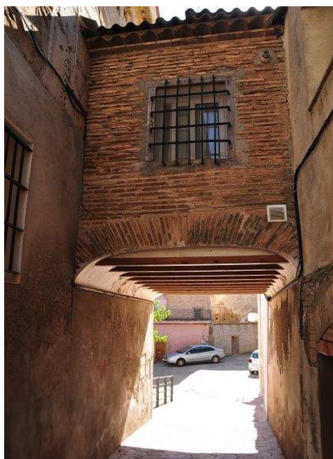
Portal de San Isidro