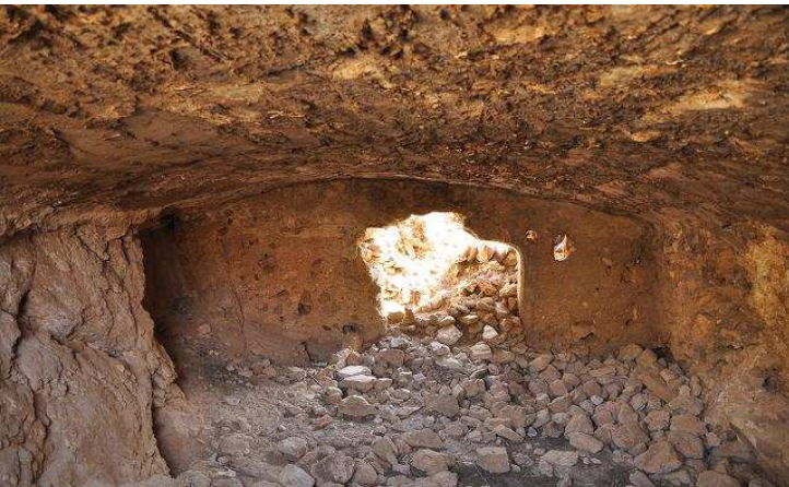
Aljibe de la fortaleza