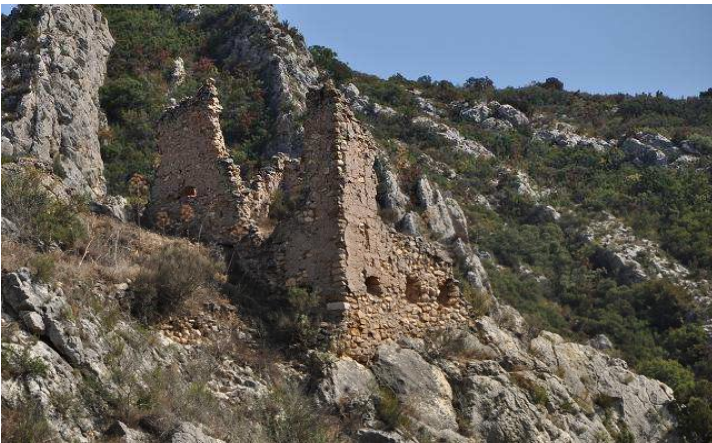
Detalle de la torre