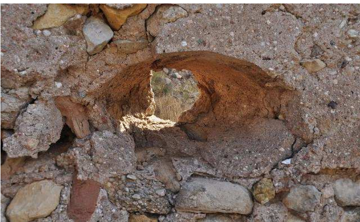
Tronera para arma de fuego