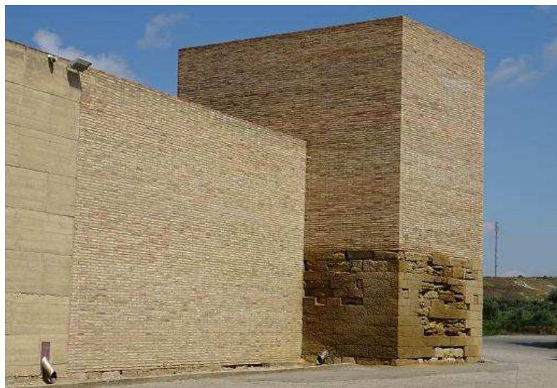
Torreón de Azcón