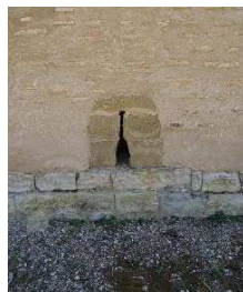
Detalle de las aspilleras abiertas en el muro