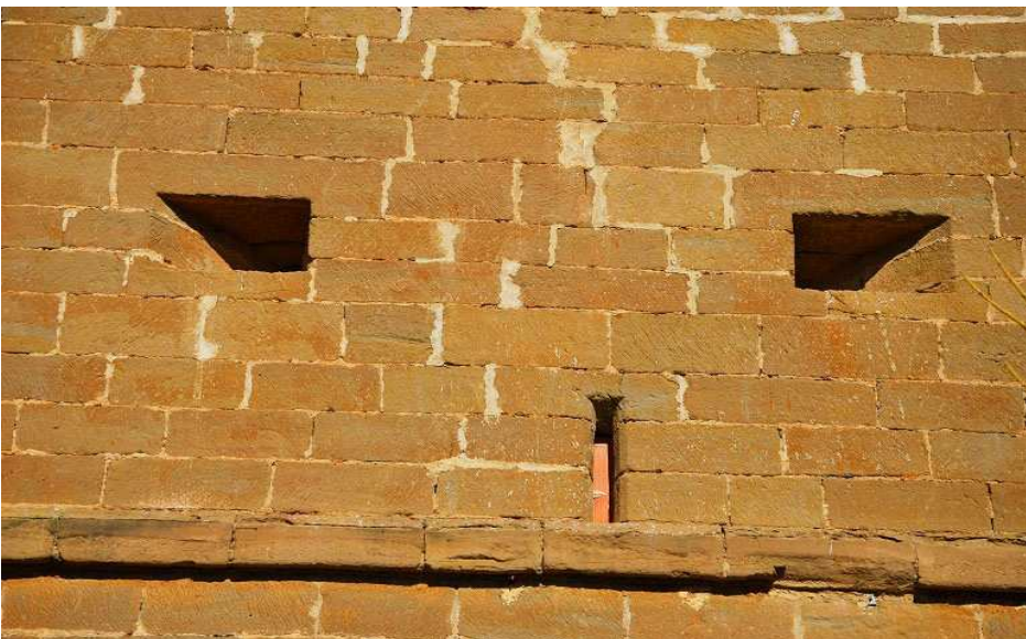
Detalle de dos de las seis aspilleras.