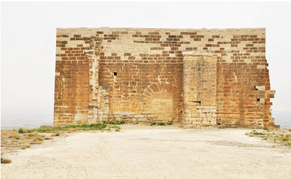
Parte norte de la ermita-castillo