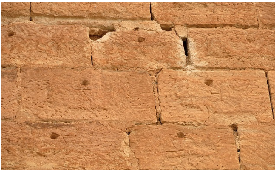
Detalle de los sillares con sus marcas de cantero y los agujeros para elevar los sillares.