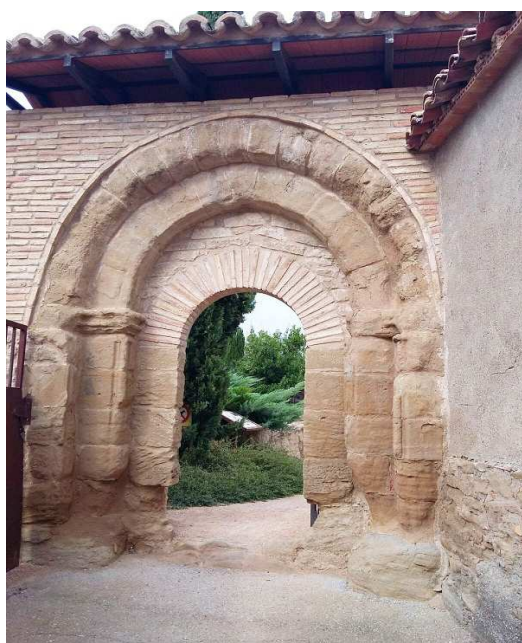
Detalle de la puerta de acceso