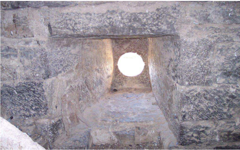
Diversos elementos defensivos ubicados en la torre parroquial, troneras, aspilleras y aspilleras con orbe