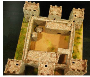
Reconstrucción de la fortaleza