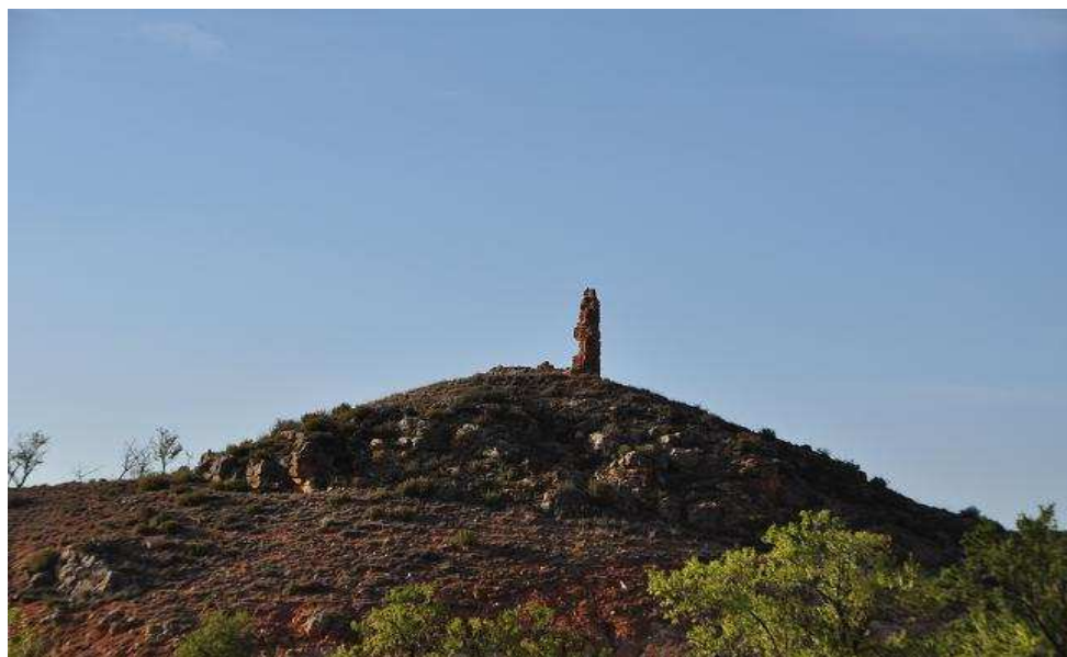
Vista del emplazamiento