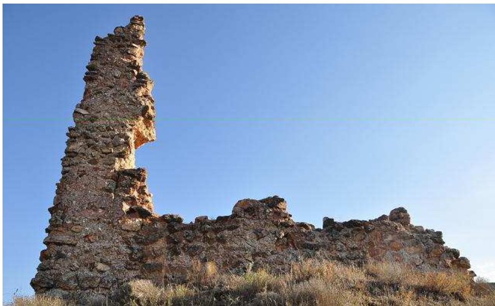
Vista exterior de la torre