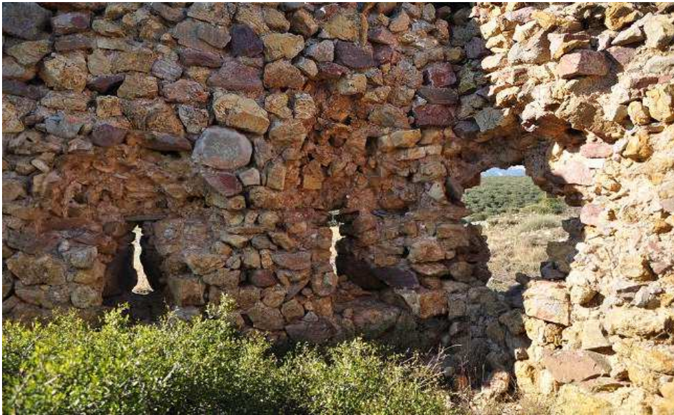
Detalle de las saeteras desde el interior