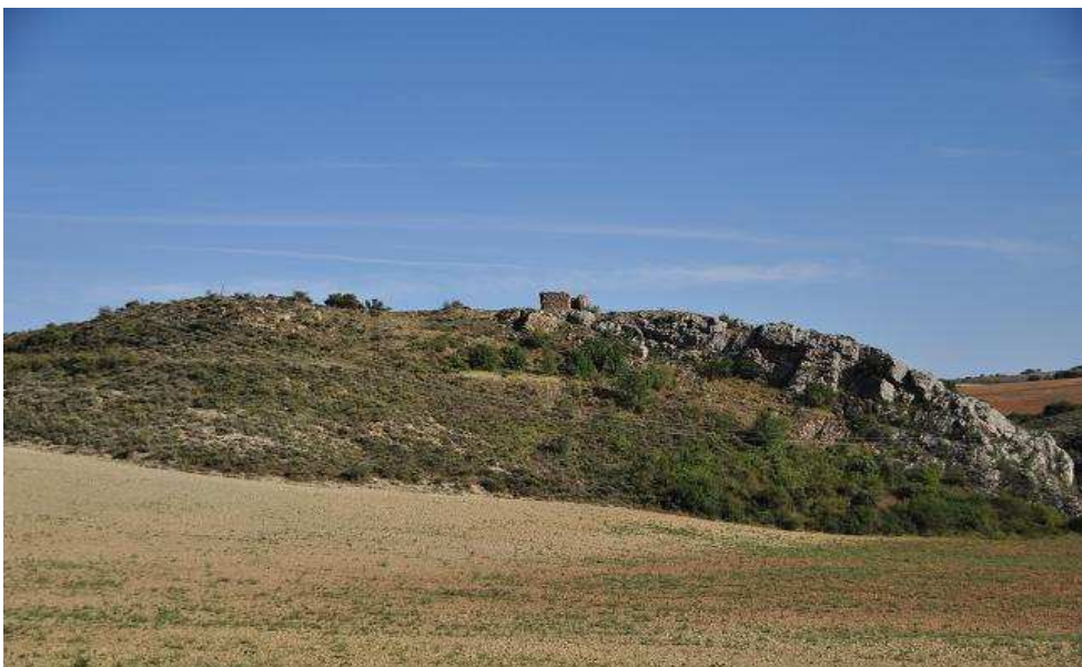
Vista desde la carretera