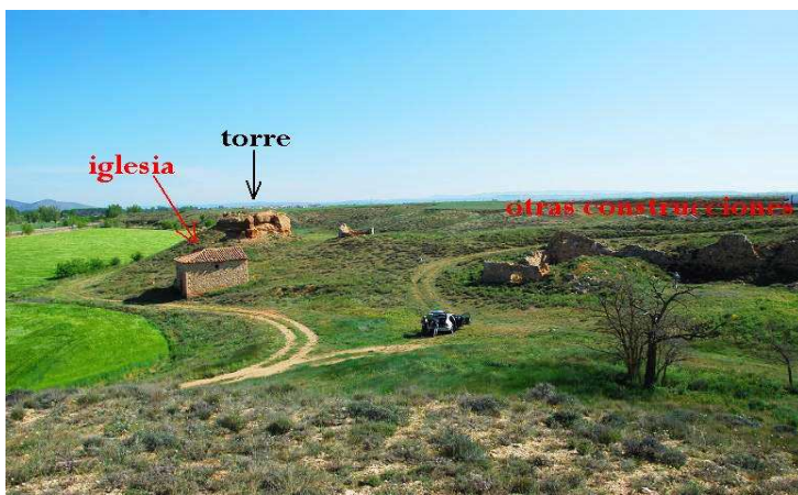
Vista general del despoblado