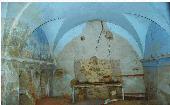
Interior de la iglesia/ermita