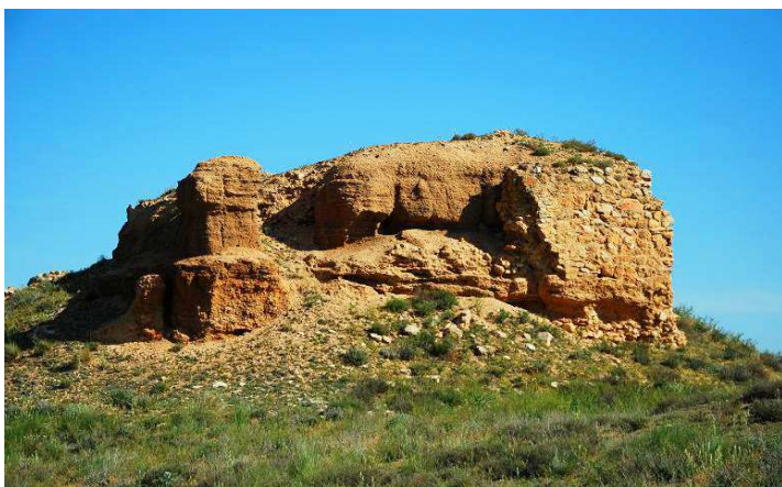
Vista de la torre