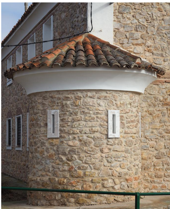
Detalles de las garitas de flanqueo provistas de aspilleras.