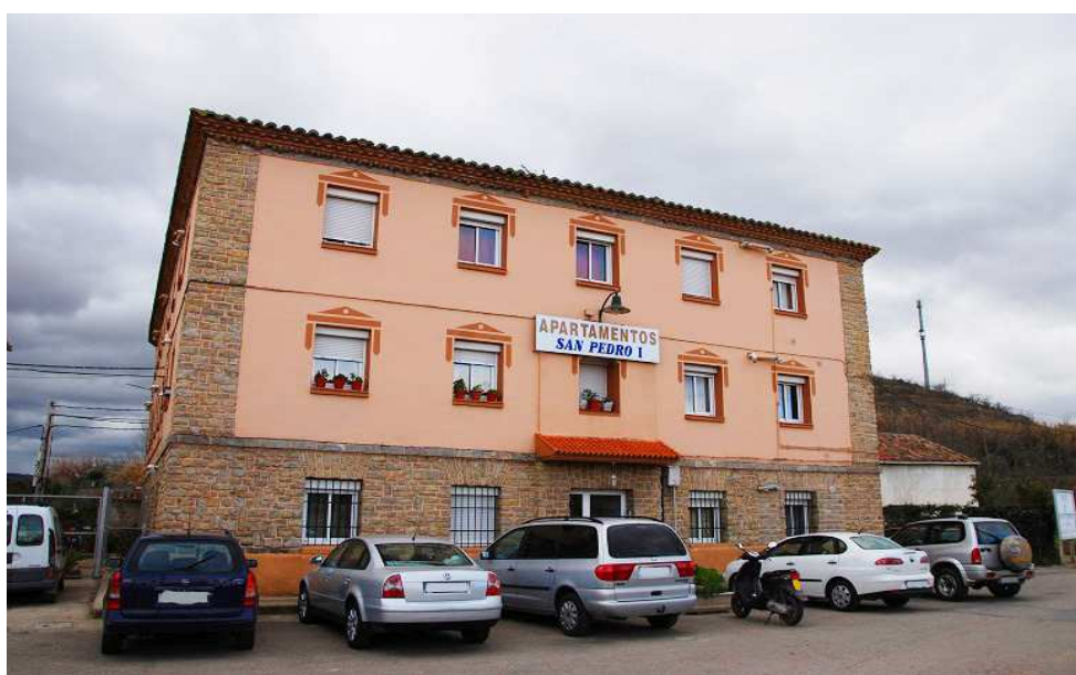
vista de la fachada principal del edificio