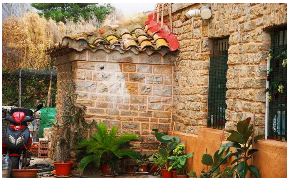
Vista de la casamata de flanqueo