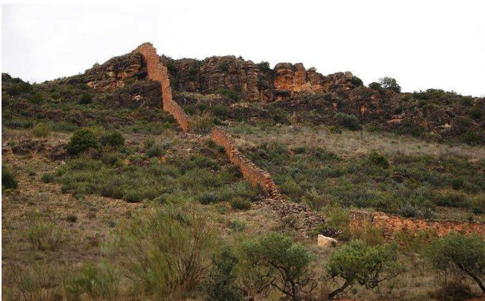
Muralla desde el N descendiendo de la peña