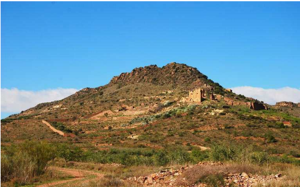
Vista general desde el N del convento y su muralla