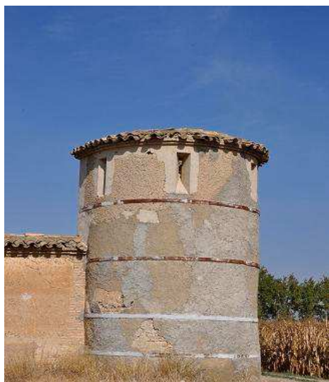
cubo de las murallas

La Cartuja es custodiada por la comunidad Chemin Neuf y en las visitas sólo se ve la iglesia y sacristía.