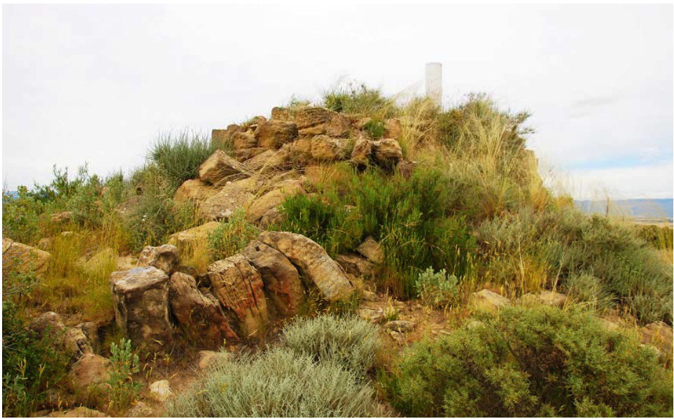
Parte derruida de la torre