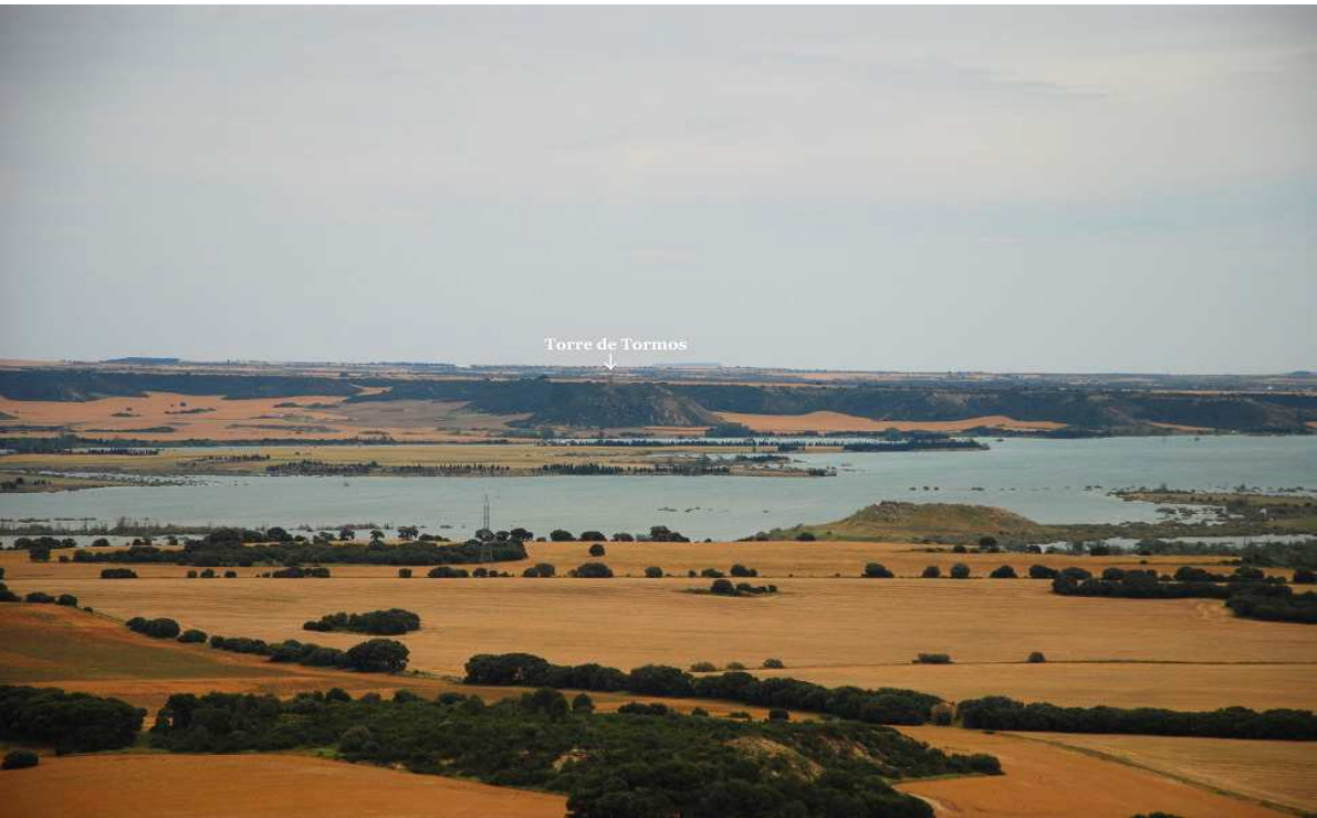
Vista desde la torre de Rosel hacia la de Tormos