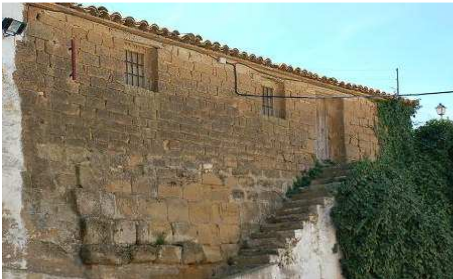
Restos de muralla