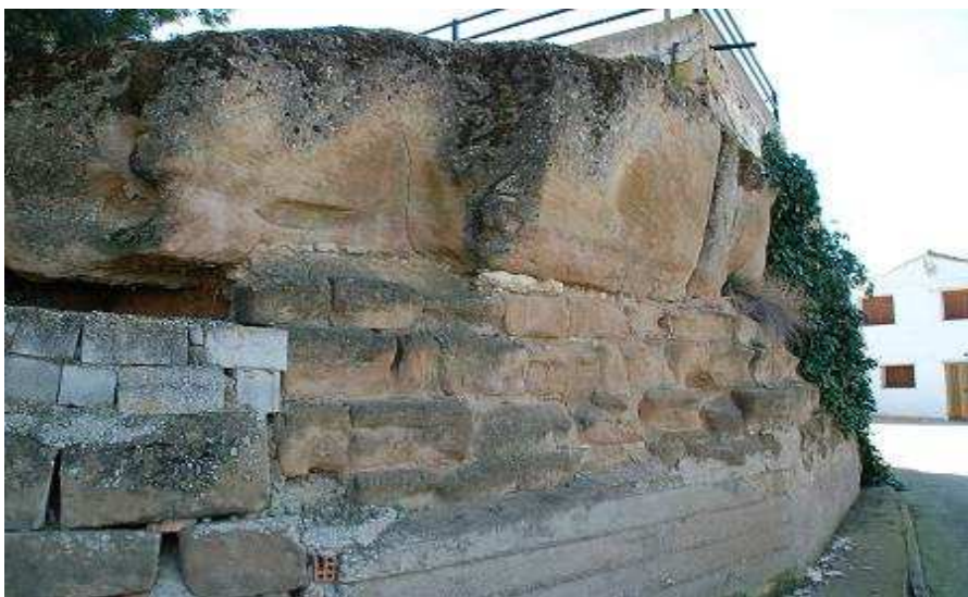
Sillares erosionados del complejo defensivo