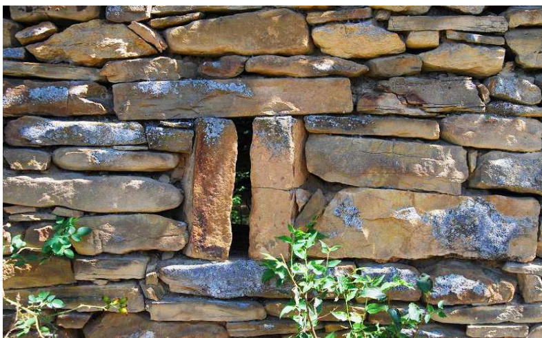
Detalle de una de las aspilleras del recinto exterior

La diferencia de la degradación que sufre el inmueble