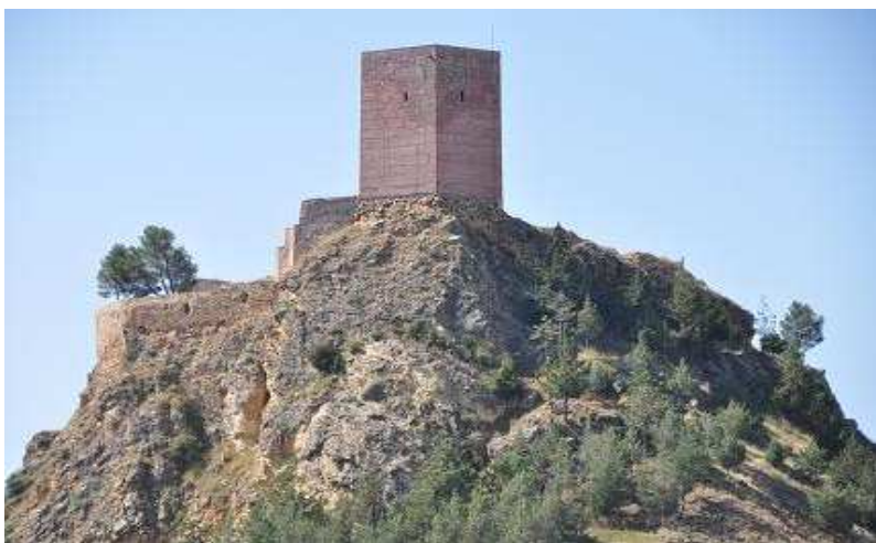
Vista general de la fortaleza