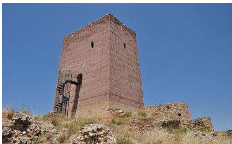
Detalle de la Torre de Homenaje