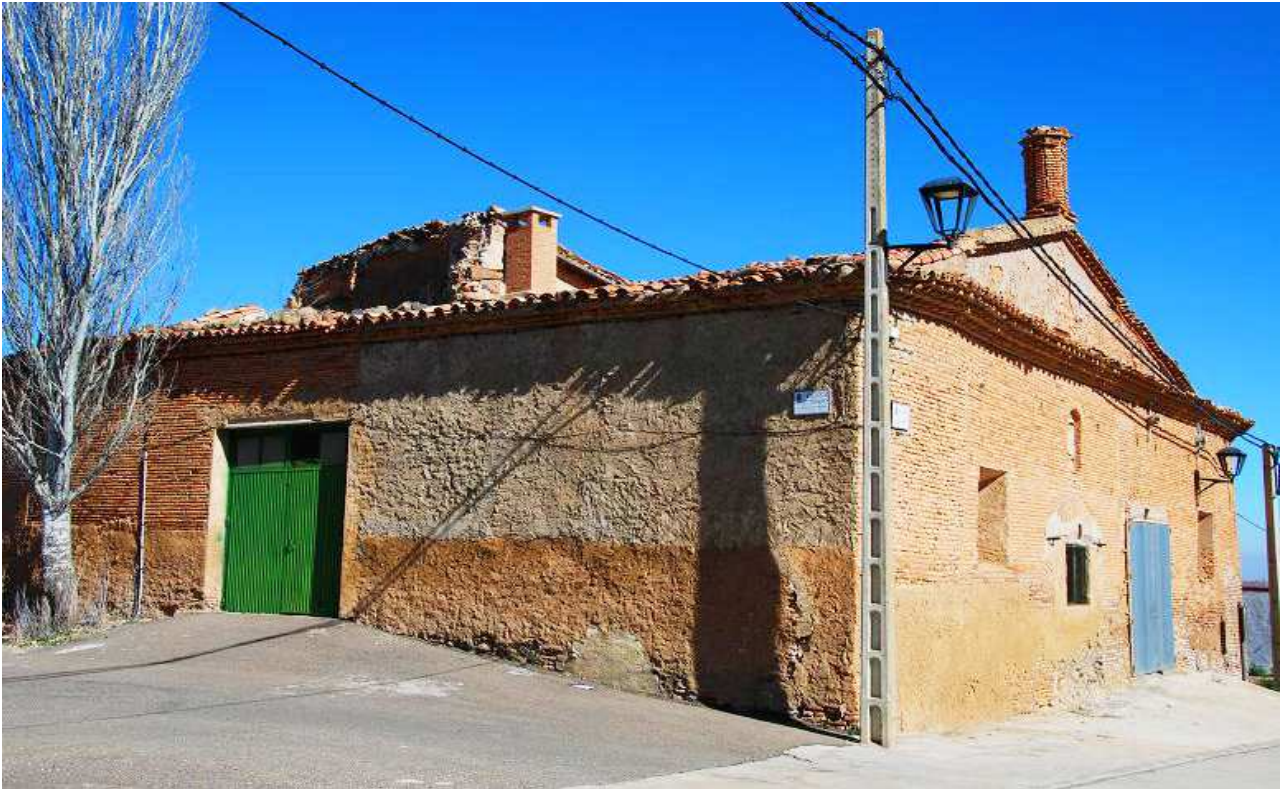
Imagen del conjunto, sobresaliendo de este la torre que mencionamos.