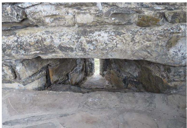
Detalle de las aspilleras abiertas en la torre