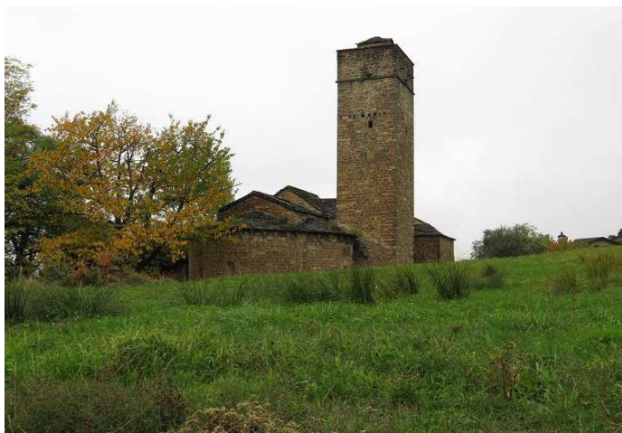
Vista de la torre, a sus pies el ábside