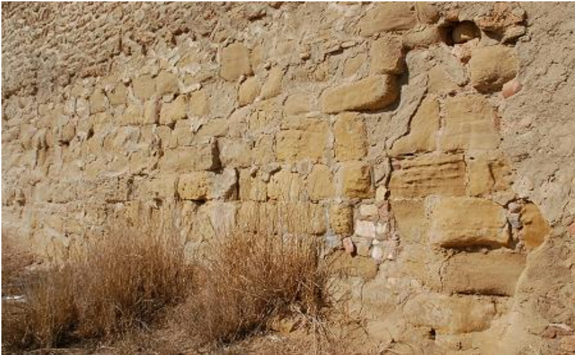
Detalle de los sillares de la muralla