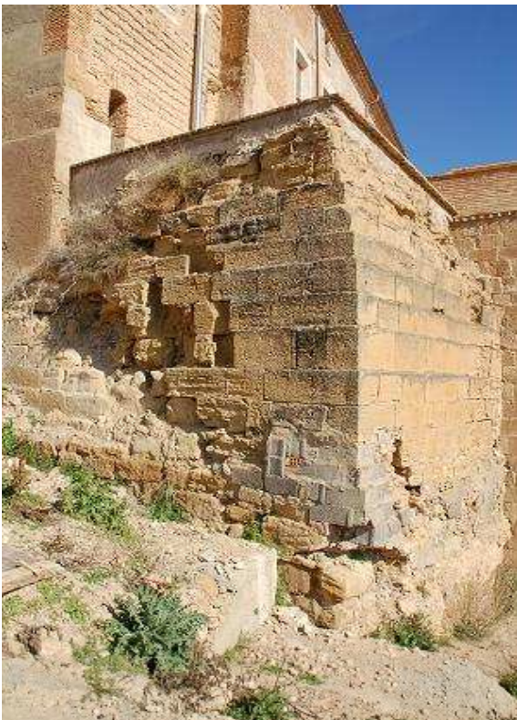
Detalle del cubo esquinado ligeramente ataludado.