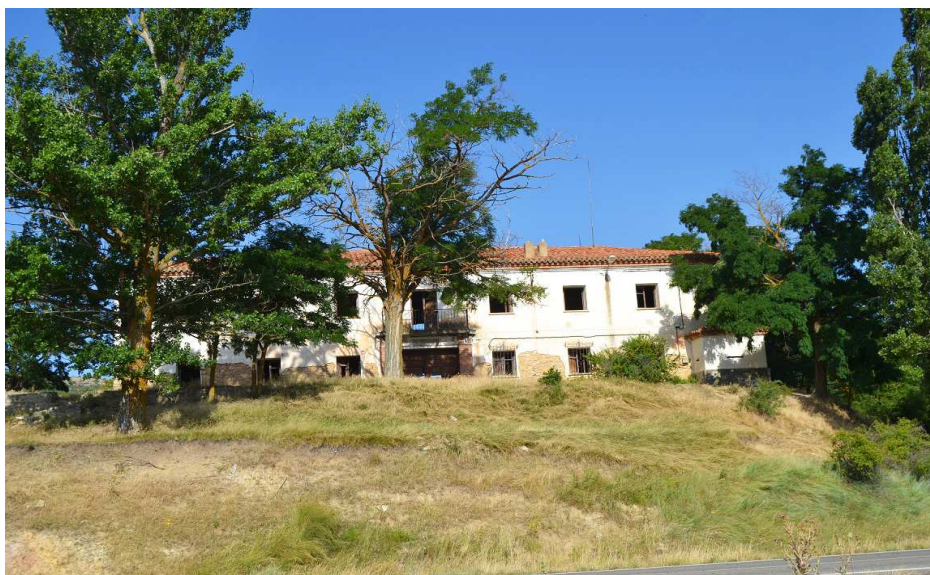
Fachada principal con su ca: