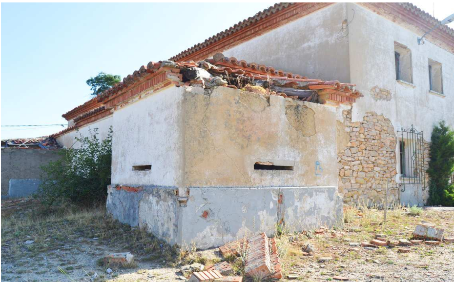
Detalle de la casamata aspil