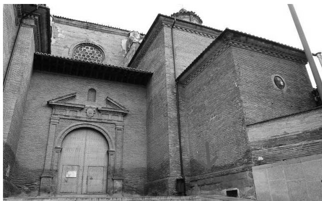
Imágenes superiores, hiladas de una de las torres del 2º recinto bajo la capilla del Santo Cristo.