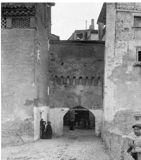
Puerta del Portillo. Imagen de Soler, s. XIX