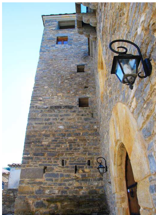
Aspilleras en la torre