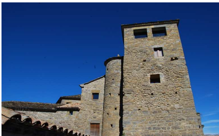
La torre con su escalera de acceso