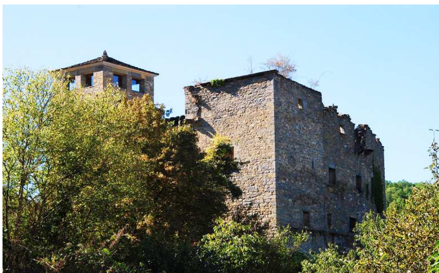
Lateral sin rehabilitar del palacio