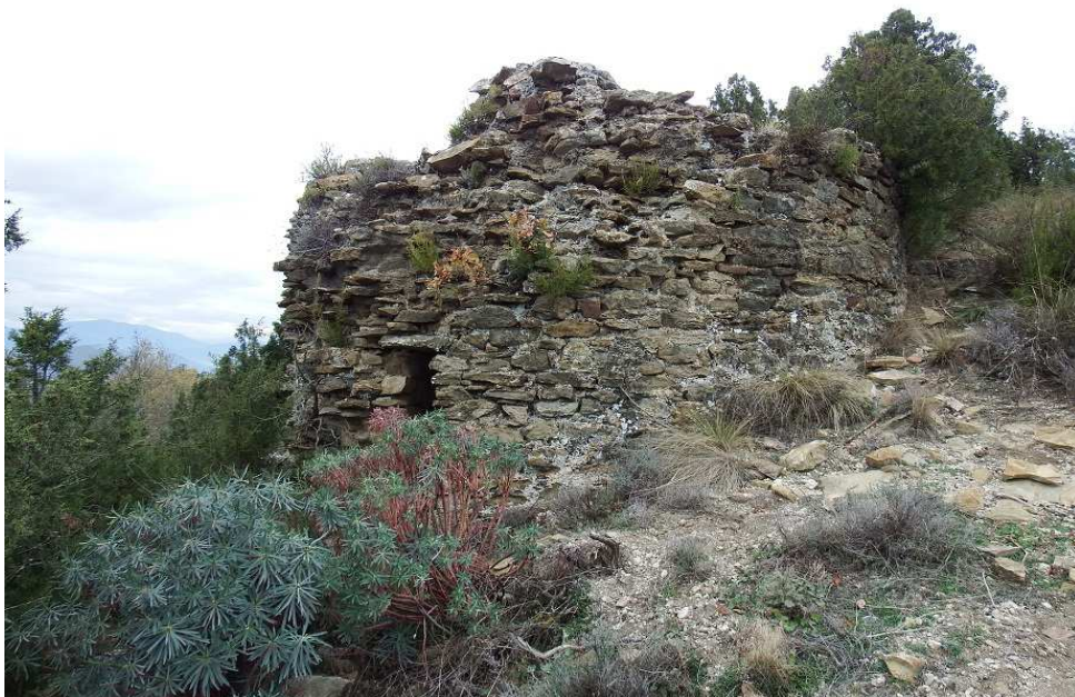
Torre meridional vista desde el exterior