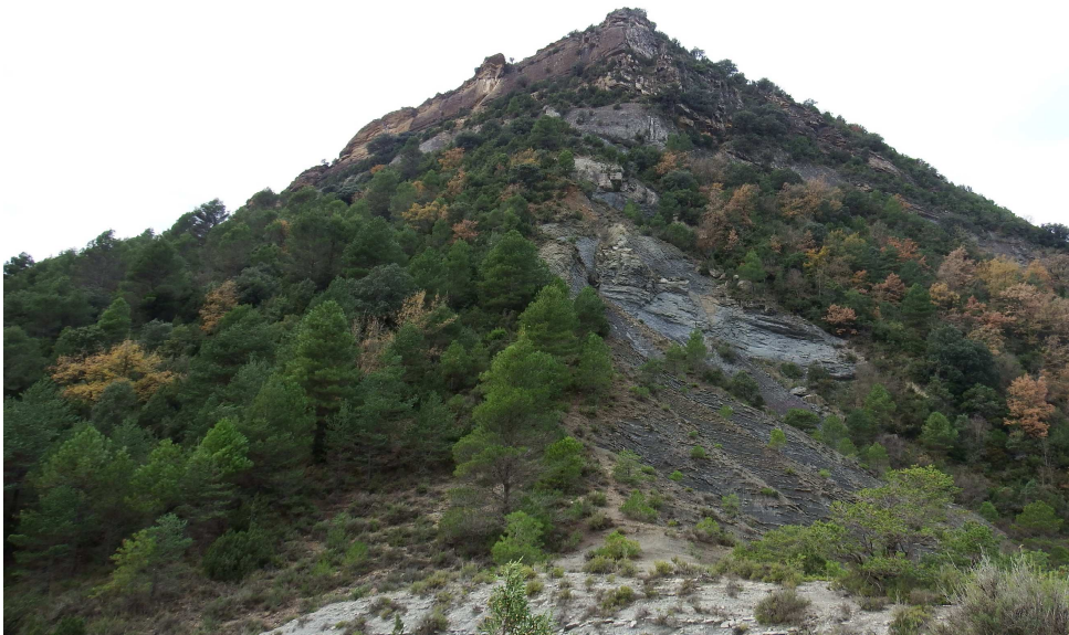
Sobre la cresta se alcanzan los restos de esta fortaleza