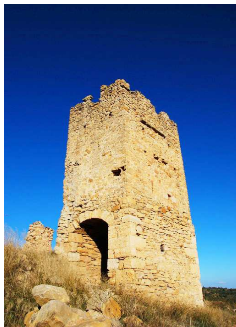
Dos vistas de la torre puerta y vista general del conjunto