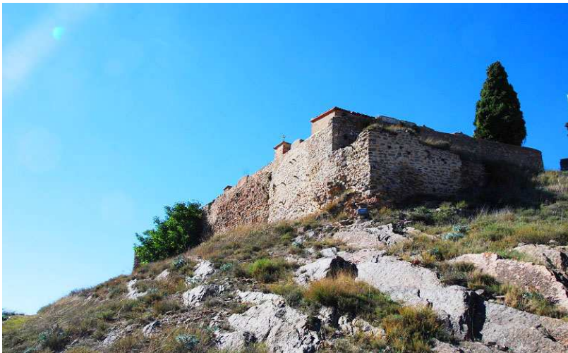
Detalle de una de las esquinas del recinto