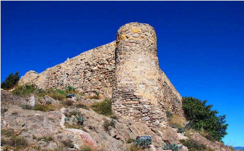
Detalle de la torre norte