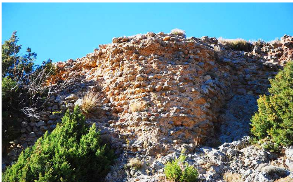
Imagen superior detalle de la muralla perimetral. Imagen inferior detalle del cubo conservado.