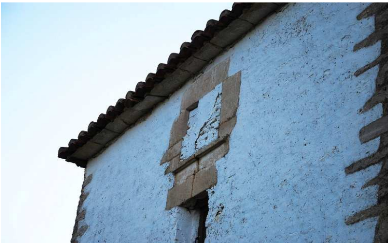
Detalle de vano tapiado