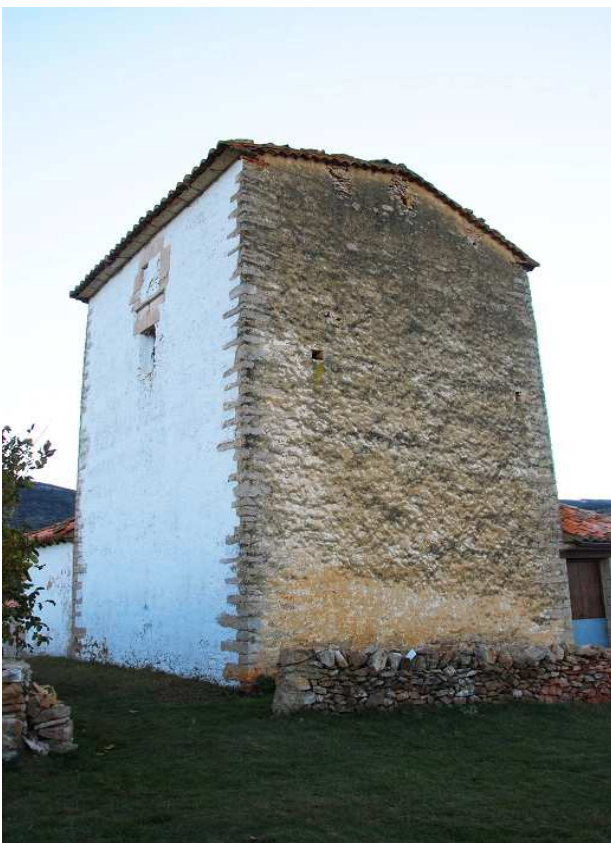
Vista de dos de sus cuatro lados